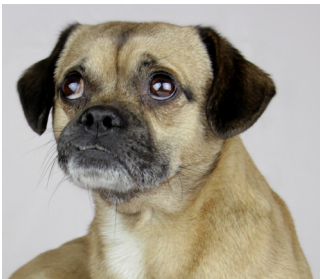
Dieser Mops kann atmen ...